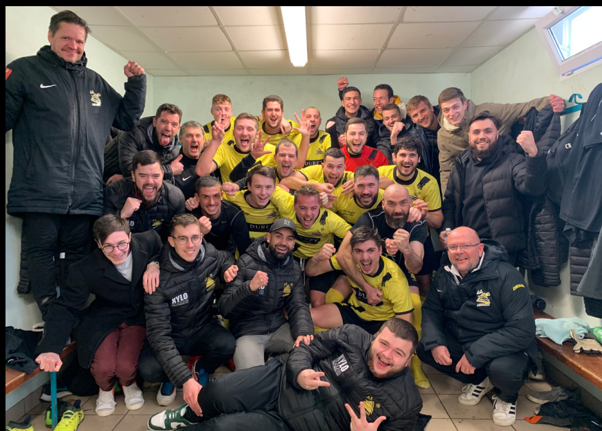
La joie des joueurs, des supporters et du staff juste après la victoire en championnat à Treize-Septiers (3-2) - Dimanche 12 février